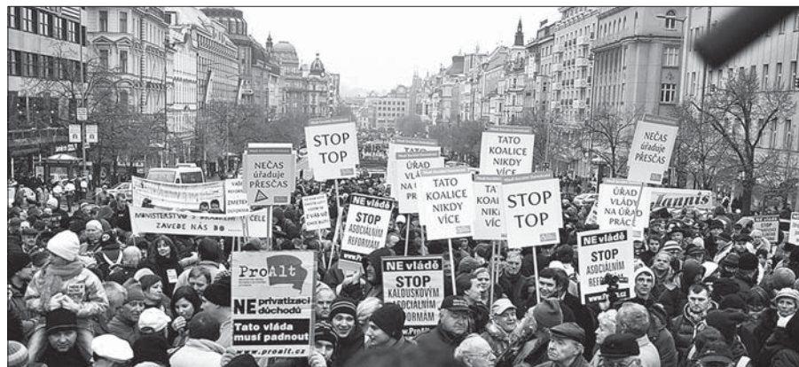
Listopadové 22. výročí „cinkání klíči“ zaplnilo pražské Václavské náměstí desítkami demonstranty nesoucími vtipné transparenty proti současné asociální vládní politice.