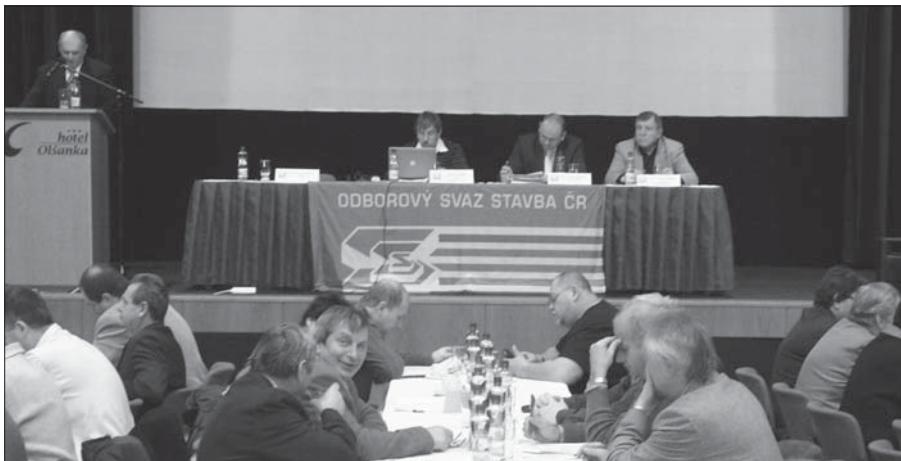
Druhé zasedání Sněmu OS STAVBA ČR se konalo již tradičně v kongresovém sále odborářského hotelu Olšanka.