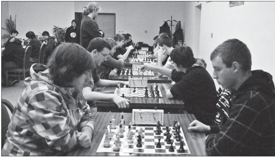
Zarytá soustředěnost všech sportovců je typická pro utkání v „královské disciplíně“, za kterou jsou považovány šachy.