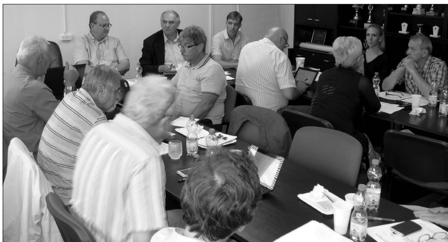
Předsednictvo OS Stavba ČR se tentokrát konalo v nových prostorách, tj. v zasedací místnosti OS Stavba ČR na adrese svazu OS Stavba ČR, nám. Winstona Churchilla 1800/2