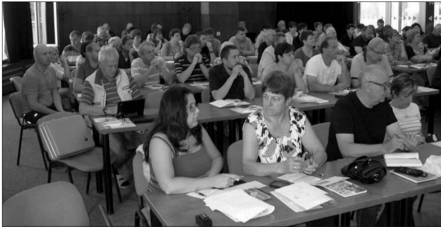
V hotelu Bezděz ve Starých Splavech se uskutečnilo letošní školení funkcionářů OS Stavba ČR, a to pro všechny základní a místní organizace v Čechách a na Moravě.

V měsíci červnu se dle schváleného plánu práce OS Stavba ČR na rok 2016 uskutečnilo pravidelné školení funkcionářů základních a místních organizací. Poprvé se uskutečnilo společné školení funkcionářů z Čech a Moravy v krásném prostředí v blízkosti Máchova jezera v hotelu Bezděz ve Starých Splavech.