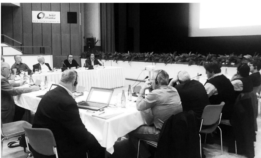
Snímek ilustruje atmosféru setkání předsedů odborových svazů skupiny zemí W6 (tj. Německa, Rakouska a Polska, Maďarska, Slovenska a ČR), kteří na této schůzce, která se uskutečnila 19. a 20. května v Praze, se snažili zformulovat společný postoj těchto zemí k politice odborových svazů sdružených v Evropské odborové federaci stavbařů a dřevařů (EFBWW) při obhajobě práv zaměstnanců prostřednictvím odborových svazů

Tajemník EFBWW Werner Buelen seznámil přítomné s návrhem revize směrnice Evropské komise (EK) při vysílání pracovníků do zahraničí. Jde o to, že zahraniční pracovníci, např. Poláci, Maďaři, kteří po nějakou dobu pracují v západoevropských zemích, dostávají nižší mzdu než řádní zaměstnanci v těchto zemích. Proto se v EK jedná o to, že by se tato směrnice měla pozměnit tak, aby, jak požadují odbory, zahraniční pracovníci dostávali za stejnou práci stejnou mzdu. Podle Buelena to však zatím nevyžaduje, že by EK v tomto duchu změnila dosavadní směrnici. Značný vliv, kromě zaměstnavatelských svazů, mají v této